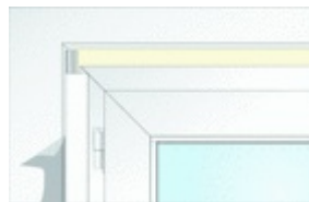
Bild 3: Die Eckverbindung wird mittels Ausbruch an einer Leiste hergestellt. Die zweite Leiste wird seitlich angesetzt.