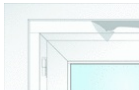
Bild4: Die Leisten werden stumpf gestoßen.