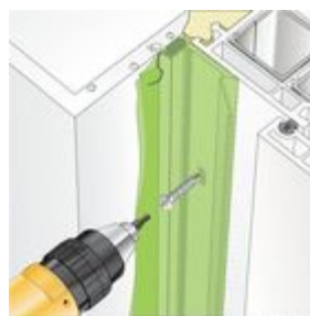
Bild2: Befestigung mit geeigneten Schrauben.