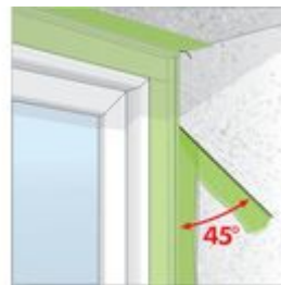
Bild3: Überstehende Folie mit dem Reißfaden unter 45° abreißen.