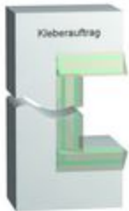
Bild 2: Kleberaupen an den Ecken